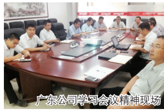
广东公司学习会议精神现场