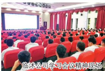
临沂公司学习会议精神现场

7月9日，集团召开了2015年上半年度总结会暨大干100天动员会议，会议精神是对6月份总裁办公会会议纪要的全面深化和升华，对于做好集团下半年度重点工作、圆满完成年度工作目标具有十分重要的指导意义。会后，集团上下将会议精神与实际工作紧密结合，掀起了一股学习会议精神的热潮。奋力冲刺全年目标任务的号角已经吹响，全员通过深入学习、贯彻、落实会议精神，将进一步坚定信心，克服困难，以决胜的气势和面貌，圆满完成集团年度工作目标，为实现集团从“中国领先”向“世界领先”的宏伟目标做出更大的贡献。