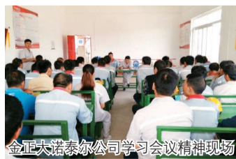
金正大诺泰尔公司学习会议精神现场