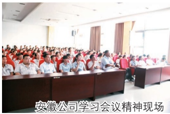
安徽公司学习会议精神现场