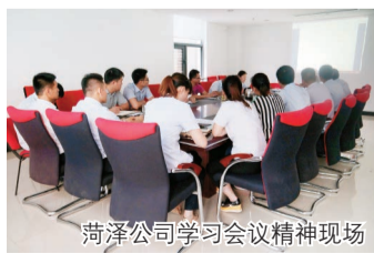
菏泽公司学习会议精神现场