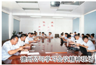
德州公司学习会议精神现场