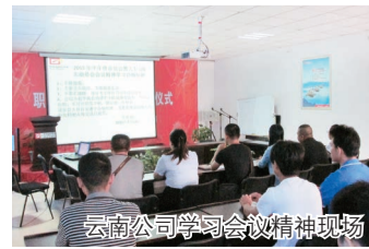
云南公司学习会议精神现场