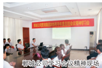
郸城公司学习会议精神现场