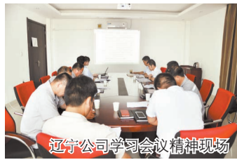
辽宁公司学习会议精神现场