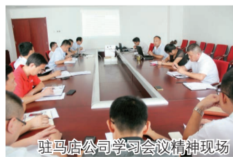
驻马店公司学习会议精神现场