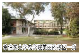
希伯来大学农学院美丽的校区一角