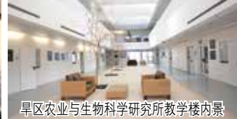
旱区农业与生物科学研究所教学楼内景

一直以来，以色列人用高科技农业技术在沙漠里建造绿洲的美名享誉全球。盛誉的背后，是以色列人建立的一整套强大的由政府部门、科研机构 and 农业合作组织紧密配合的科研、开发与教育、推广服务体系，不少大学也设有一些专业性研究单位。高效优质的产学研结合便是这片神奇的沙漠绿洲生生不息的源动力。