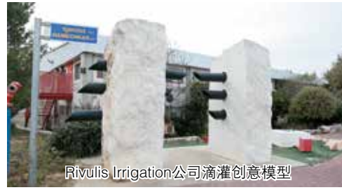
Rivulis Irrigation公司滴灌创意模型