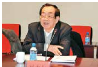
国务院参事室参事刘志仁发言

会后，国务院参事室参事刘志仁等领导一行实地参观了国家缓控释肥工程技术研究中心展厅、科研智能温室、集团缓控释肥和水溶肥生产车间，深入了解了集团在技术研发、创新平台、生产工艺、产品推广等方面的相关情况。