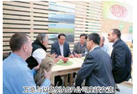
万总与以色列AGR公司座谈交流