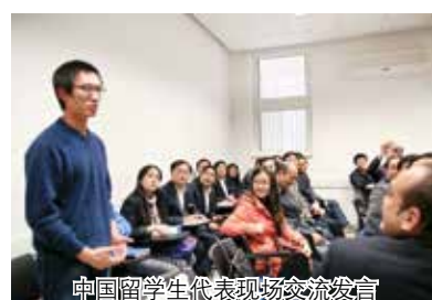
中国留学生代表现场交流发言