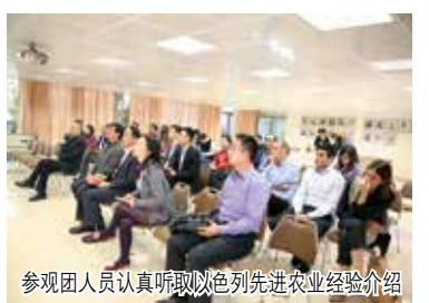
参观团人员认真听取以色列先进农业经验介绍