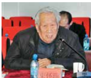
中国工程院院士、山东农业大学园艺学院束怀瑞教授发言