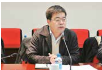
农业部耕地处处长宁鸣辉发言