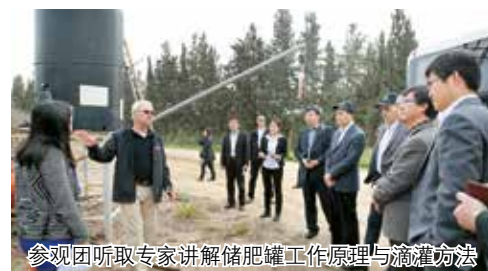
参观团听取专家讲解储肥罐工作原理与滴灌方法