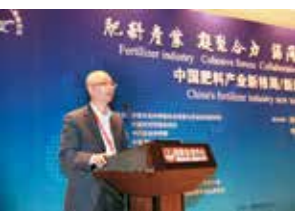
科学技术部农村科技司副司长蒋丹平致辞