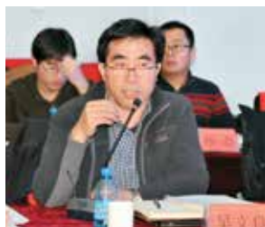
中国农业大学资源与环境学院院长吴文良教授发言