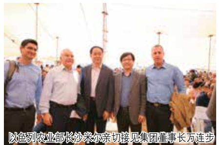
以色列农业部长沙米尔亲切接见集团董事长万连步