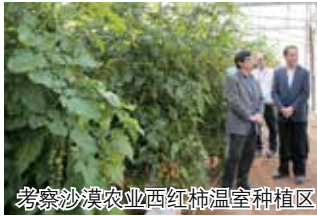
考察沙漠农业西红柿温室种植区