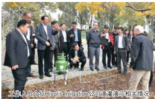
工作人员介绍Rivulis Irrigation公司滴灌演示相关情况