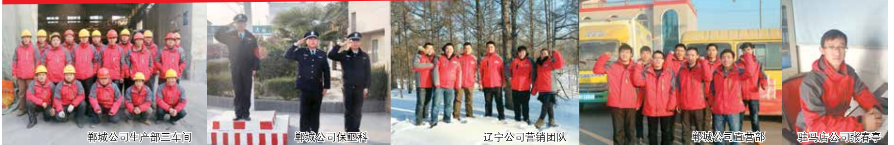
郸城公司生产部三车间