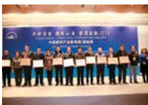
金正大被授予“中国肥料产业科技发展创新企业”