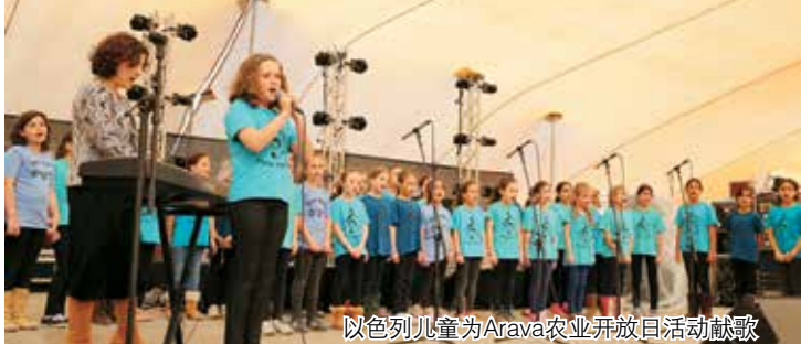
以色列儿童为Arava农业开放日活动献歌