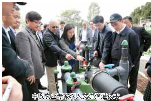
中以农业专家深入交流滴灌技术