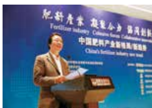
中国农业科学院副院长唐华俊致辞