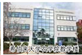
希伯来大学农学院教学楼