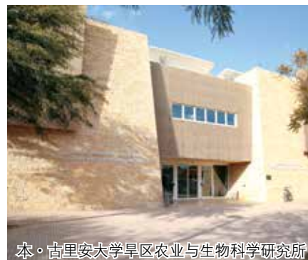
本·古里安大学旱区农业与生物科学研究所