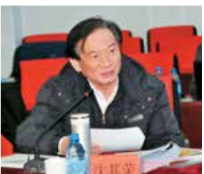
南京农业大学原副校长沈其荣教授发言