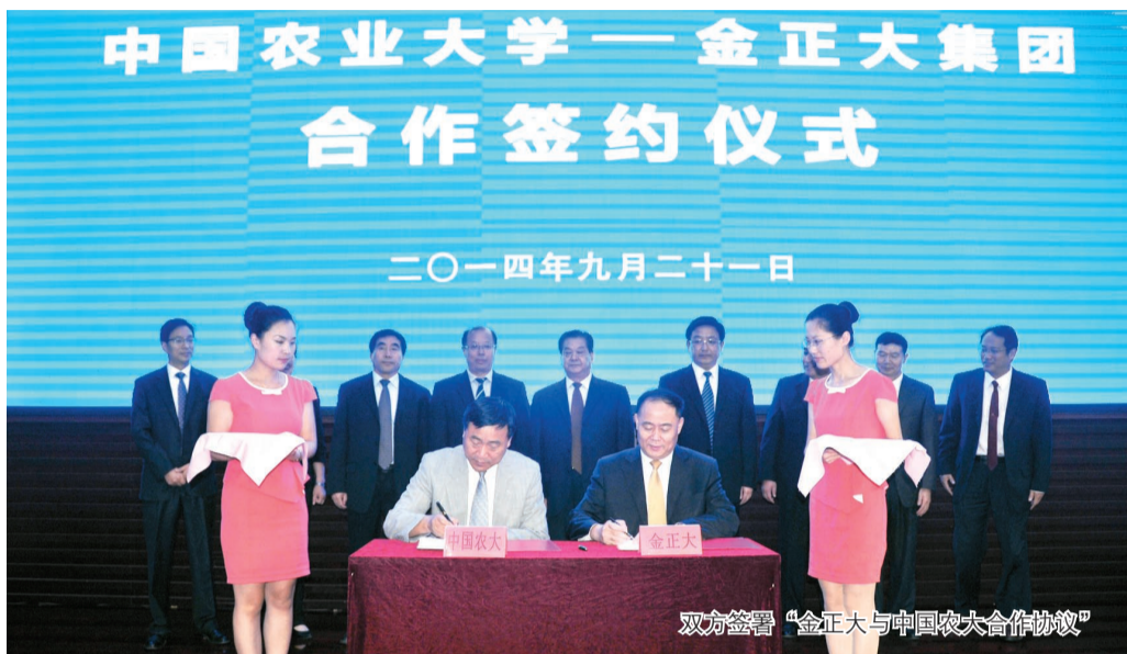
双方签署“金正大与中国农大合作协议”

仪式上，双方签订了“水溶性肥料产品研发与农化技术服务协议”，在科研合作、新型肥料技术研发方面，双方将成立合作工作委员会。在平台建设、科研管理等方面开展合作，联合开展项目研究、技术攻关，加强科研平台建设，并逐步建立资源共享机制。在技术研发方面，双方将就水溶肥等新型肥料及水肥一体化技术的研发、试验和推广、作物营养系统研究、农业生物技术的研究、药肥技术等新型肥料