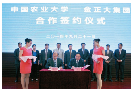
双方签署“金正大与中国农大国际型人才培养项目协议”

集团和中国农业大学的合作，是中国农业校企产、学、研的强强联合，是生产企业和国家高校联手推动农业发展、农民增收的重要举措。新一轮合作协议的签署，将使双方在人才培养、技术研发、核心技术攻关、新型肥料推广等方面交流合作进一步深入，也是双方优势互补、推动长期战略合作的重要举措，标志着双方合作进入了新阶段。