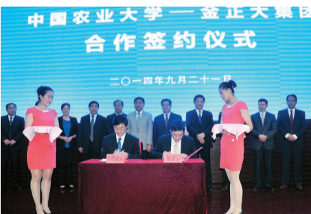
双方签署“金正大与中国农大‘水溶性肥料产品研发与农化技术服务’协议”