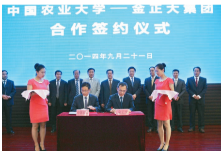
双方签署“金正大奖学金设立协议”