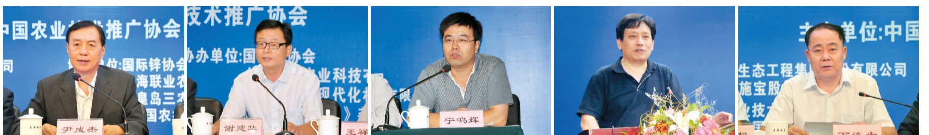
农业部原常务副部长、国务院政策研究室特聘研究员、中国农业技术推广协会会长尹成杰

会上，各企业代表、相关行业专家、教授从不同角度论述了水肥一体化技术与水溶肥发展趋势将“势不可挡”，水溶性肥料将成为我国未来最具发展潜力的肥料类型，认为对水肥一体化技术推广正当时。