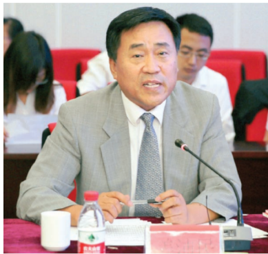
中国农业大学党委书记姜沛民