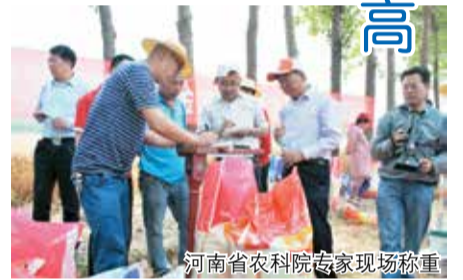
河南省农科院专家现场称重

“截至到2014年年底，河南省邮政金大地示范方已累计增产粮食128.8万吨，为河南粮食增产做出了突出贡献。为升级肥料产品，今年我们为小麦量身定做了套餐肥，让小麦‘吃’得更科学、更高效。”金正大集团总裁助理、驻马店公司总经理郇恒星表示。