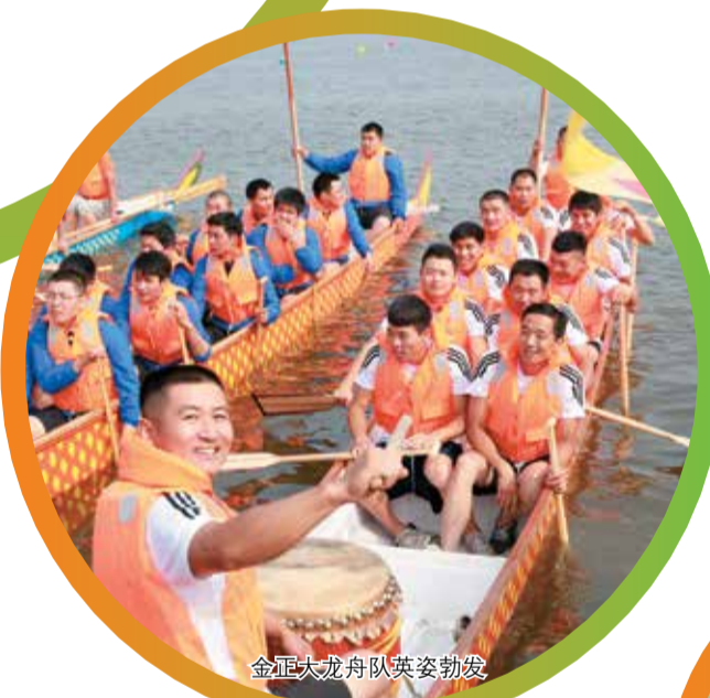
金正大龙舟队英姿勃发