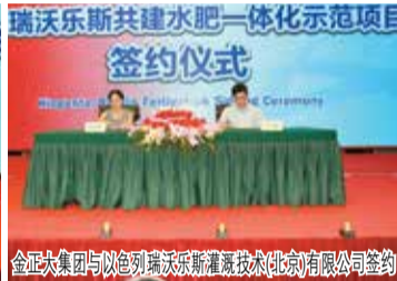
金正大集团与以色列瑞沃乐斯灌溉技术北京有限公司签约仪式