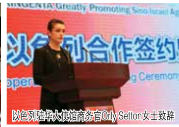
以色列驻华大使馆商务官Orly Setton女士致辞