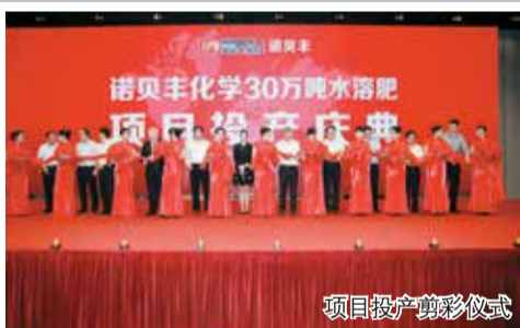
项目投产剪彩仪式