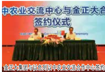
金正大集团与以色列中以农业交流合作中心签约仪式