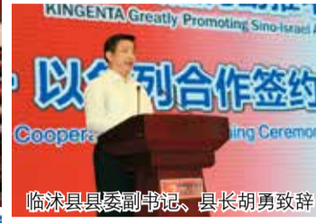
临沭县委副书记、县长胡勇致辞