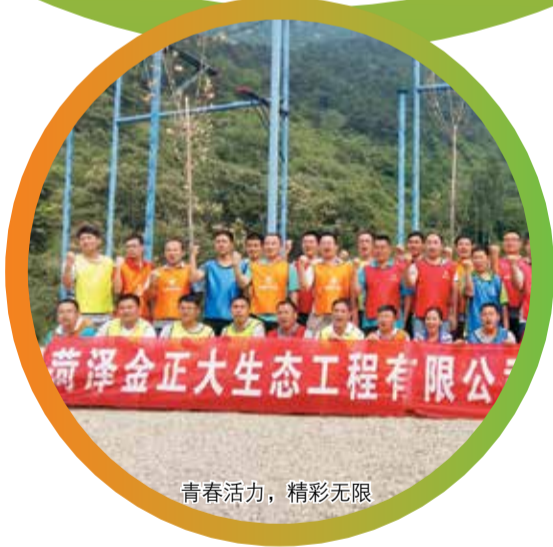
青春活力，精彩无限