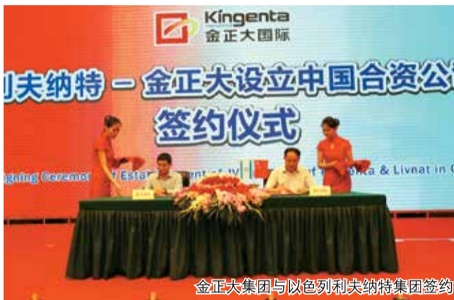
金正大集团与以色列利夫纳特集团签约

本报讯 宋伟报道 6月28日，中以现代农业合作签约仪式在金正大集团举行。仪式现场，金正大集团与以色列利夫纳特集团、以色列瑞沃乐斯公司、以中农业交流合作中心等签署了一系列合作协议，标志着中以农业合作正向深度拓展。本轮一系列中长期合作项目将带动中以农业合作进入一个崭新的时期。