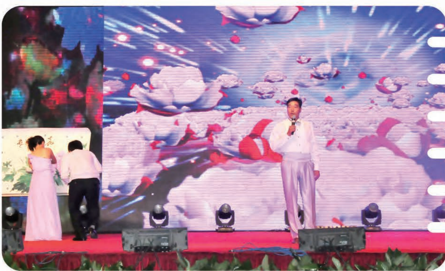
男声独唱《牡丹之歌》(菏泽公司)