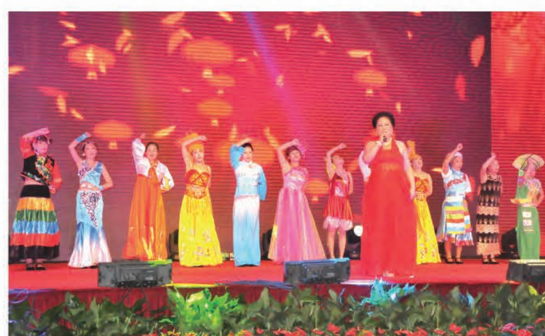
歌伴舞《欢天喜地》（辽宁公司）