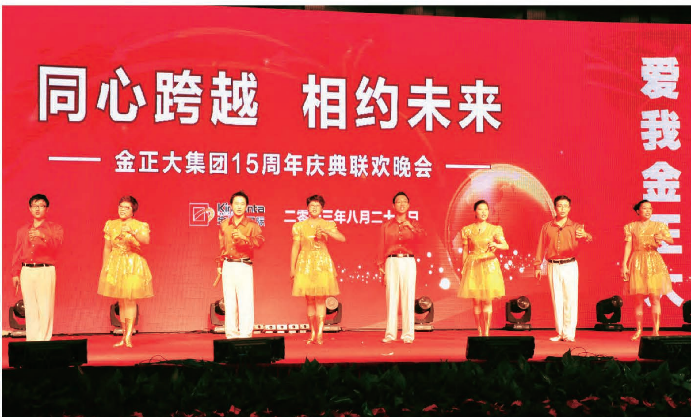
群口快板《金正大风采》（集团公司）