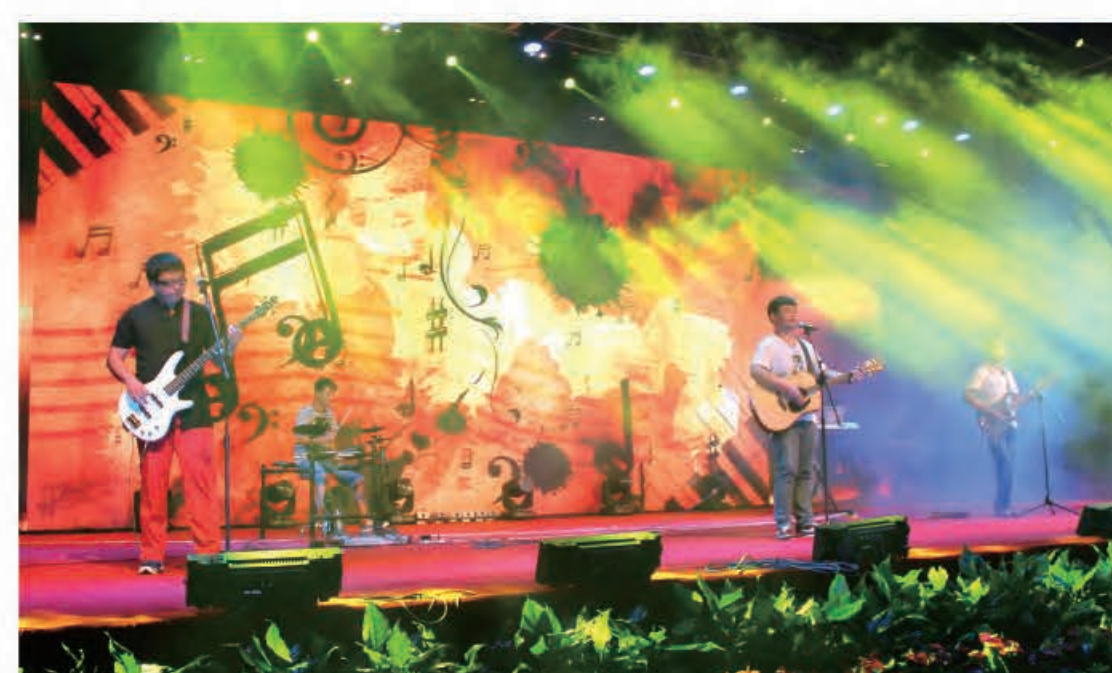
歌曲《我们的梦》（集团公司）