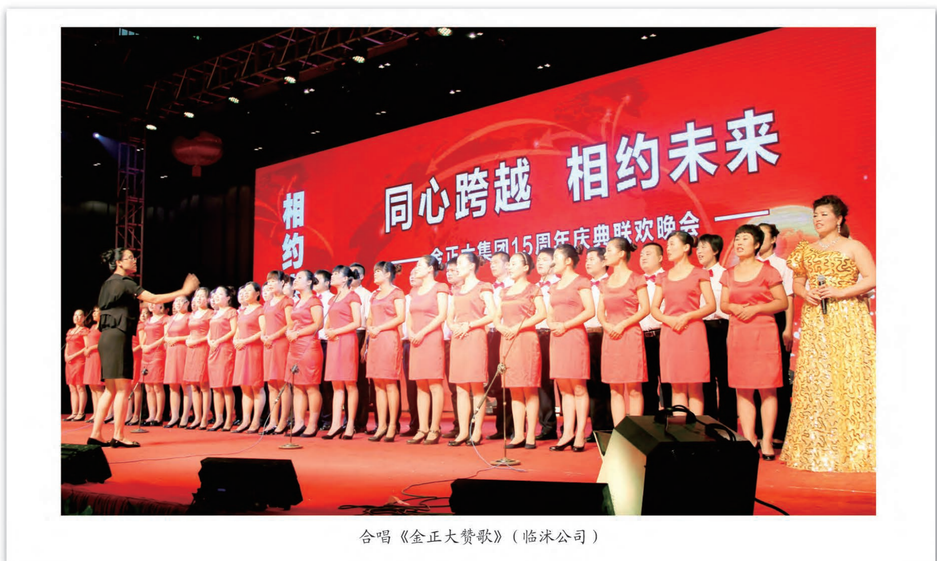
合唱《金正大赞歌》(临沭公司)