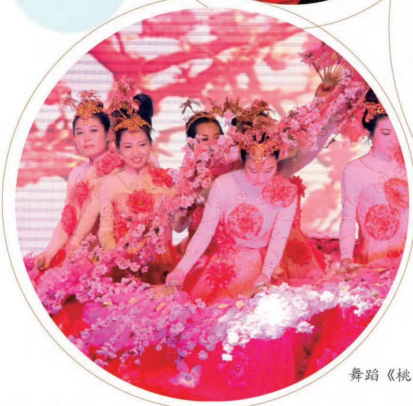
舞蹈《桃花谣》(临沭公司)