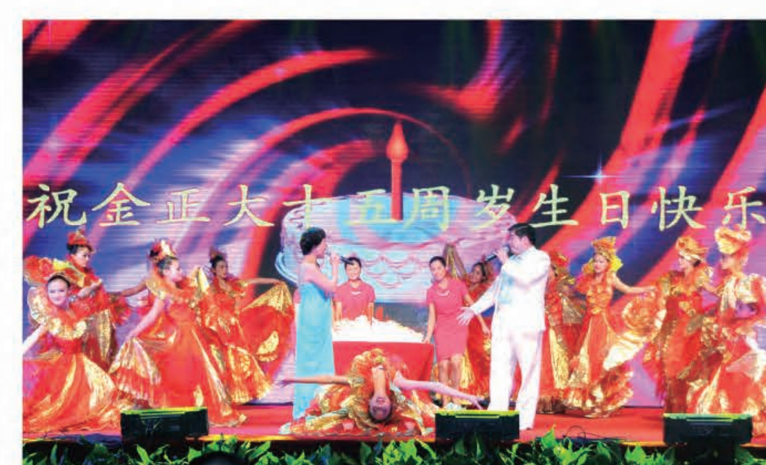
歌伴舞《今天是你的生日》（安徽公司）