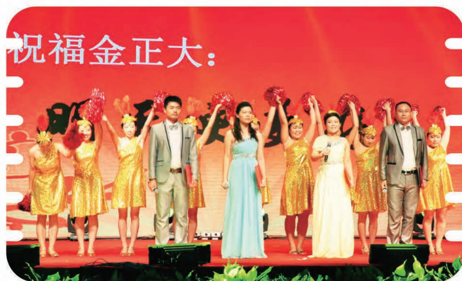
乐舞诗《诗话·金正大》(临沭公司)