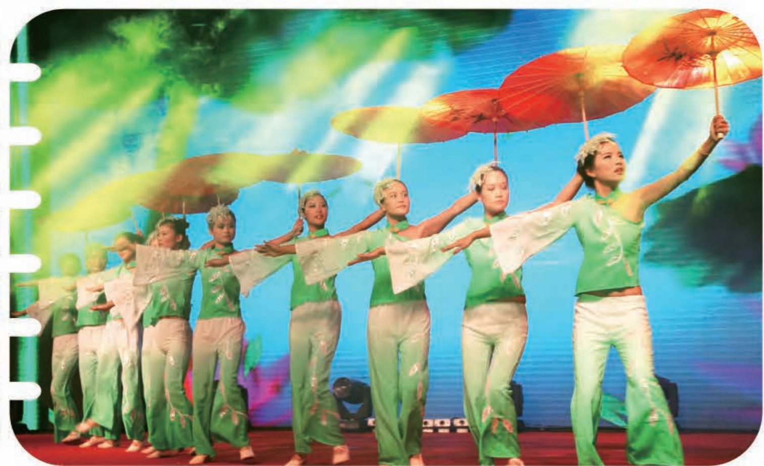
舞蹈《世纪春雨》(临沭公司)