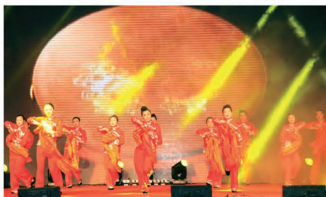
舞蹈《开门红》（菏泽公司）