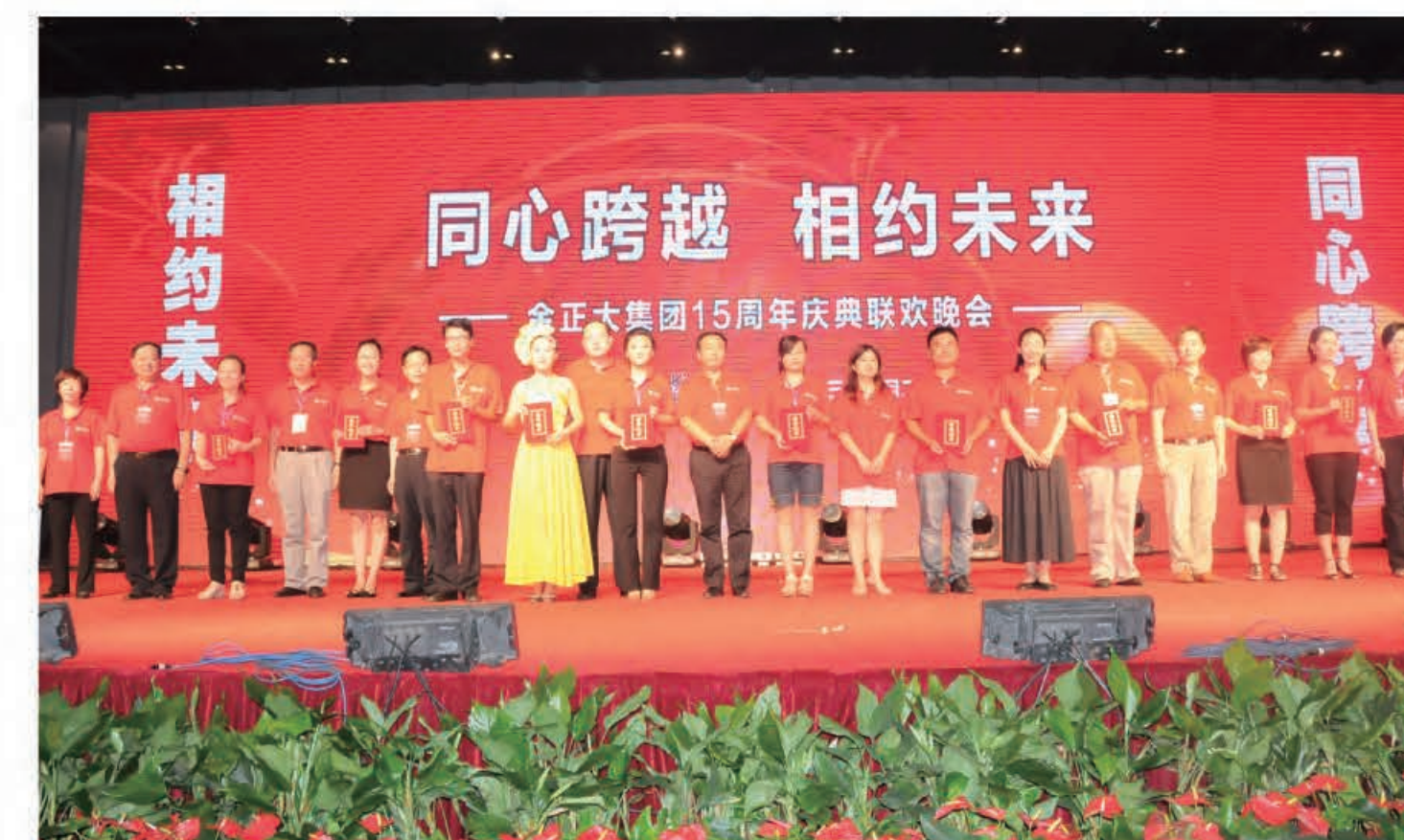
为庆典活动获奖人员颁奖