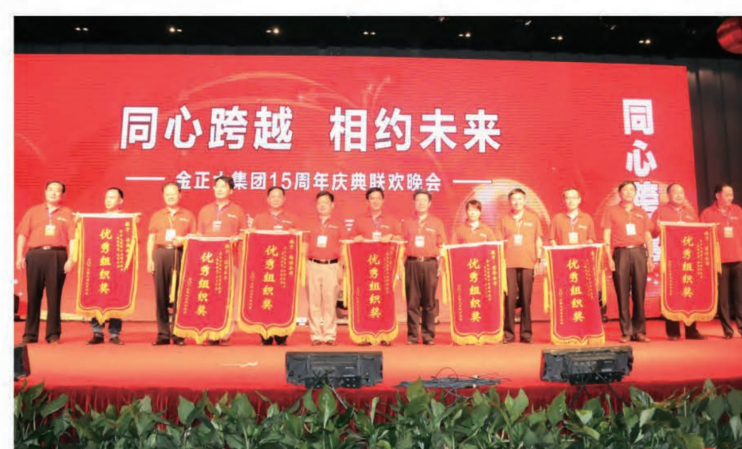
为优秀组织单位颁奖