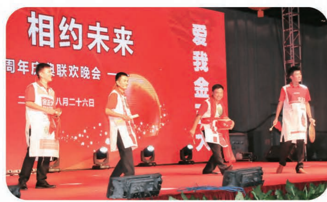
三句半《我们来把司庆贺》(临沭公司)