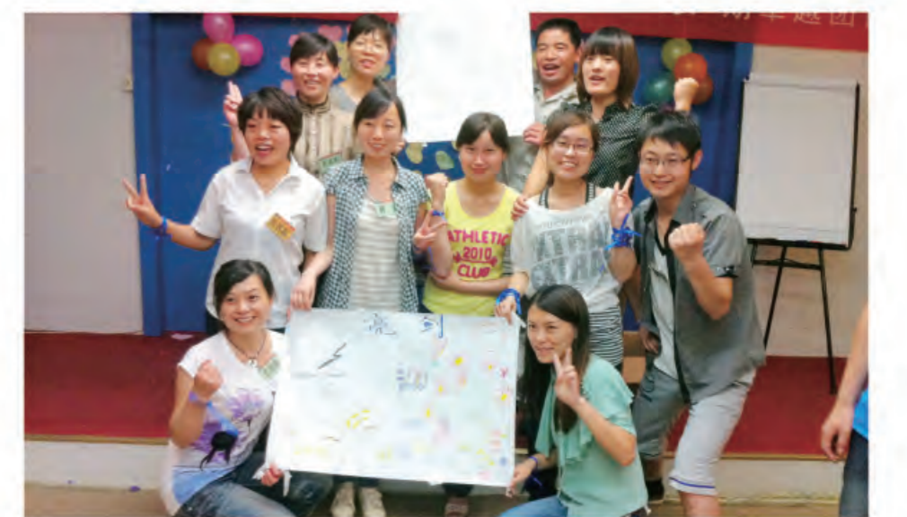
菏泽公司-财务核算部-韩方：团队的力量