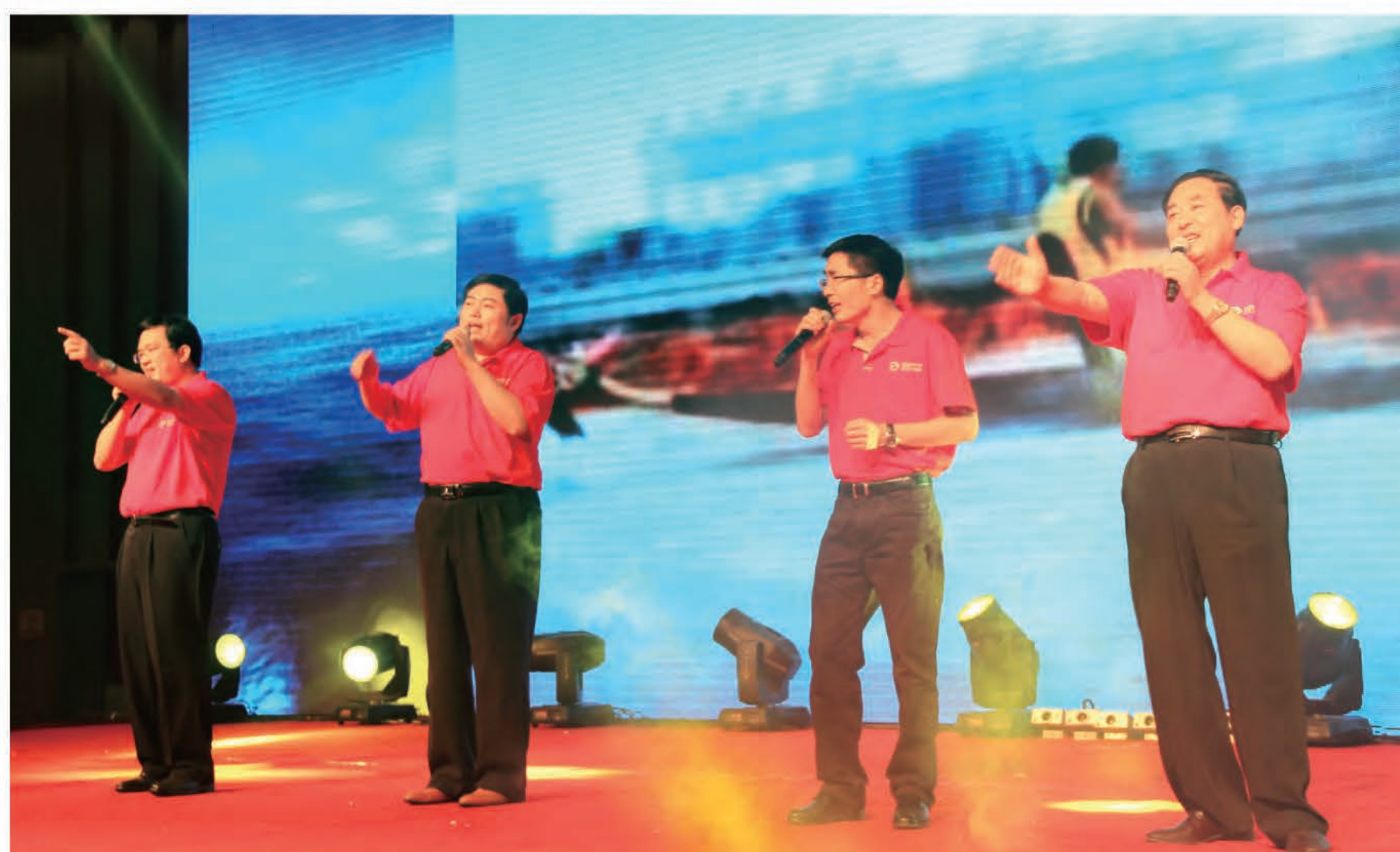
歌曲串烧《众人划桨开大船》（集团公司）