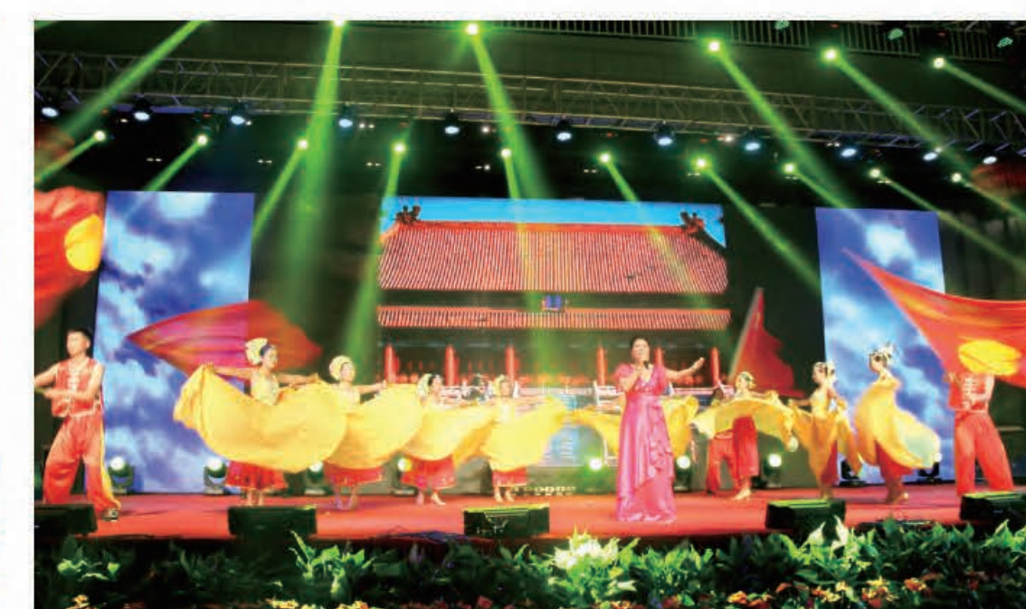
歌伴舞《感动中国》（驻马店公司）