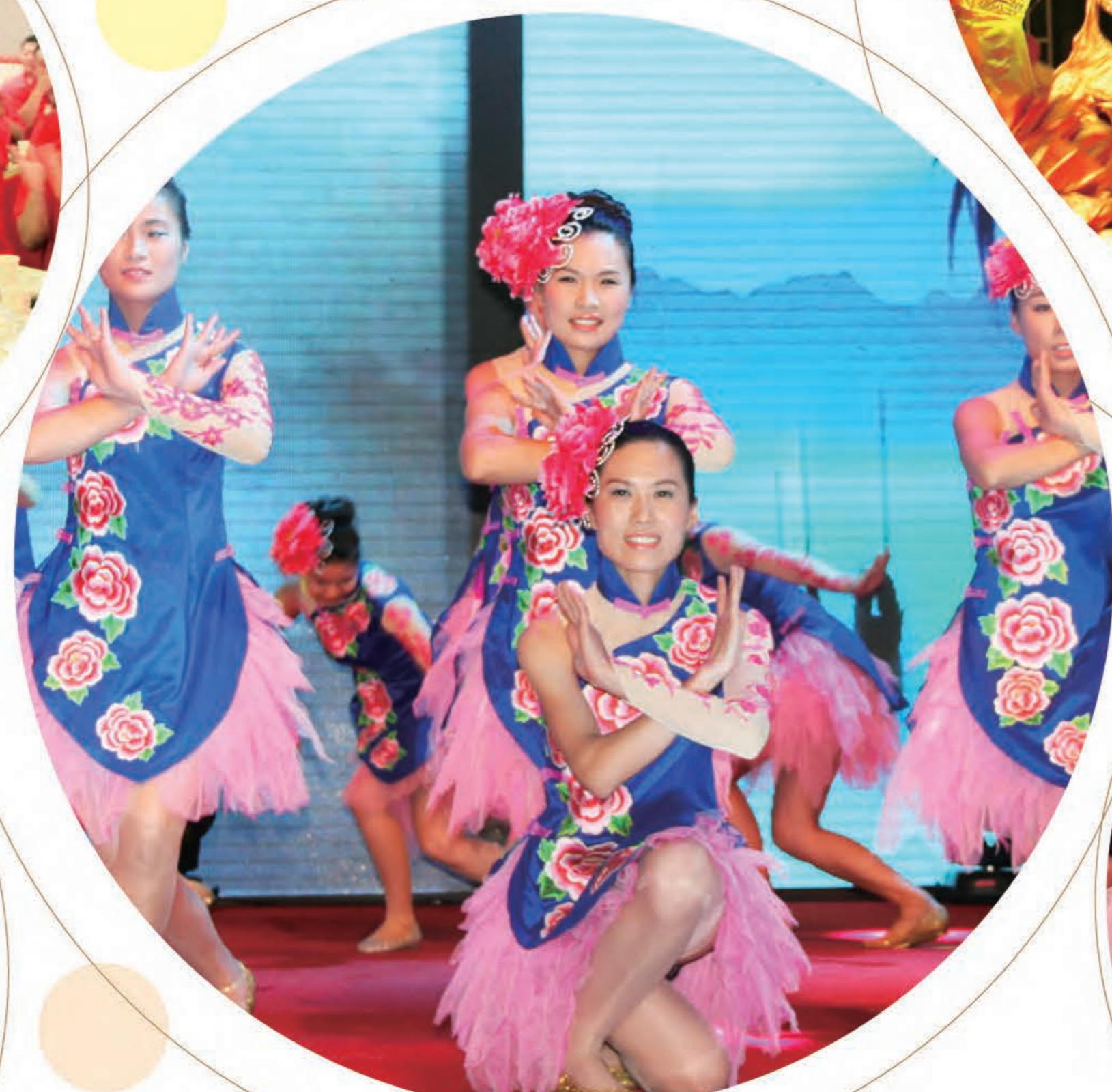
舞蹈《中国美》(集团公司)