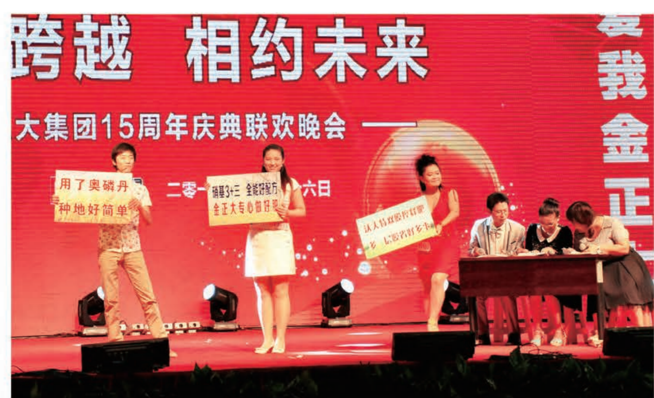
小品《我做带“盐”人》(德州公司)