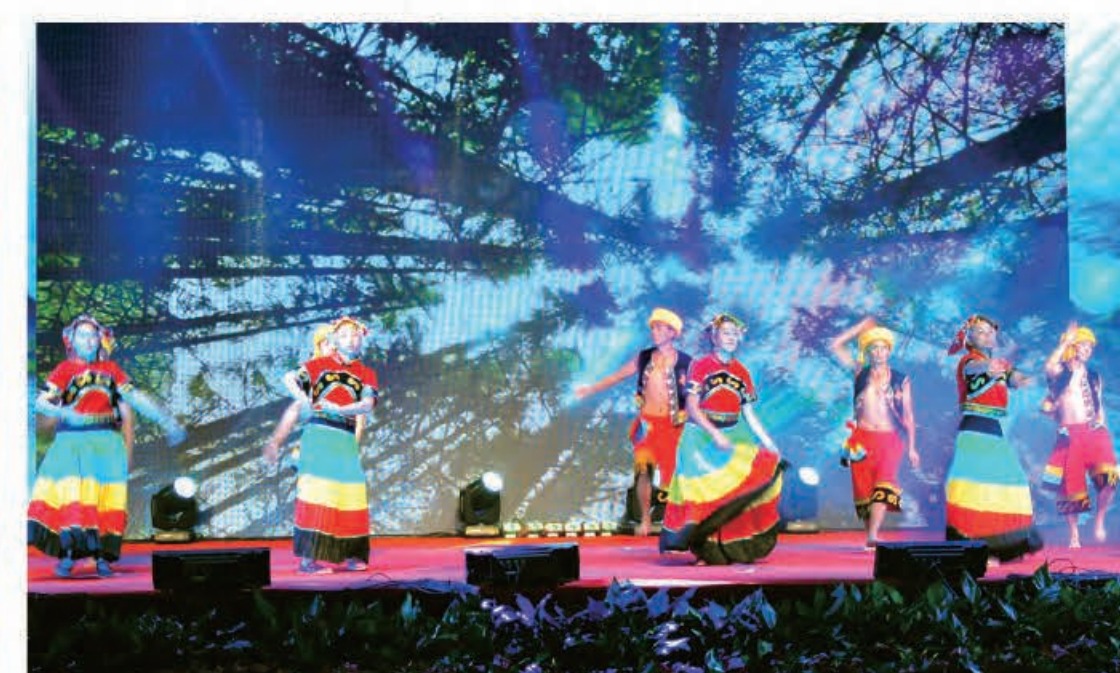
舞蹈《七月火把节》（云南公司）