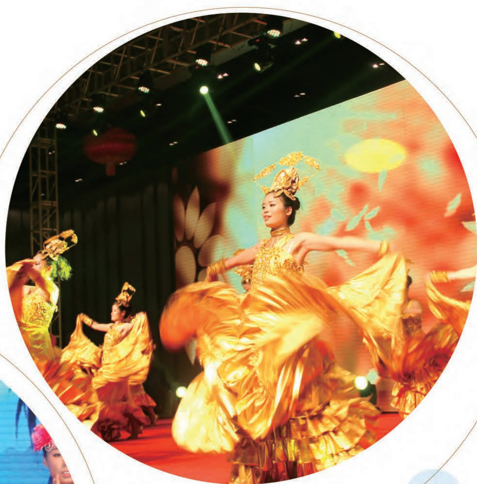
舞蹈《相信》(集团公司)