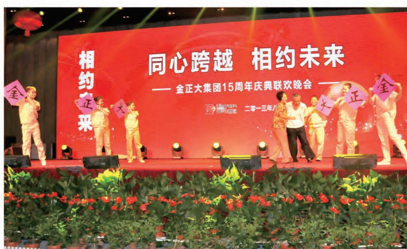
表演唱《郸城基地硕果香》(郸城公司)