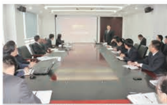
战略与投资中心、运营中心述职