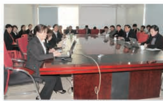
党委、工会、审计中心述职

更加明确今后努力的方向与工作重点，近期将根据公司的要求，认真地进行反思，查找短板，对提出的问题进行深刻诊断与剖析，制定切实可行的计划方案，在2014年工作中进一步增强自己的使命感、责任感和紧迫感，通过不断地学习，提高自身综合能力和岗位胜任能力，确保完成工作计划，达成工作绩效目标。