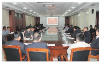
生产技术中心述职