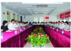
第十四届全国肥料双交会开幕式

万总在讲话中提出了三点要求:一是要充分认识信息化建设的重要意义;二是要精心组织、稳步推进信息化建设项目的建设;三是要明确信息化建设思路。万总指出,公司建设