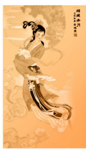
中秋赏月，是人生的一大美景。在中秋时，天高气爽，金风送爽，空气变得透明起来，正是赏月的好时节。

个温暖的笑脸。几天下来，虽然非常辛苦，但看着一个个月饼的出炉一张张开心的笑脸，我们很自豪。尤其是当我们端上热腾腾、香喷喷的月饼时，每次都是一抢而空。并且制定的每天那都保质保量，大家对我们的月饼赞不绝口，连送月饼工友也口称地道，而且皮薄馅大，很实惠。看着职工们美滋滋的吃着我们赶制的月饼，大家连日来的疲劳一扫而光。 一轮明月照千里，但每个月饼都包含着我们对中秋和浓浓的祝福，祝福全体金正大人中秋快乐、身体康健！祝我们共同的家——金正实业二部总务科 高群