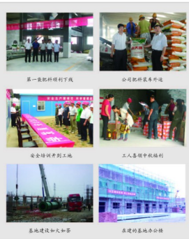
第一段肥料下线下线 公司肥料装车开道