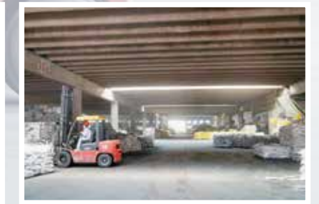
午饭时间，偌大的车间显得空旷了许多