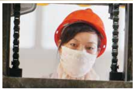
工作时需要眼观六路注意力高度集中