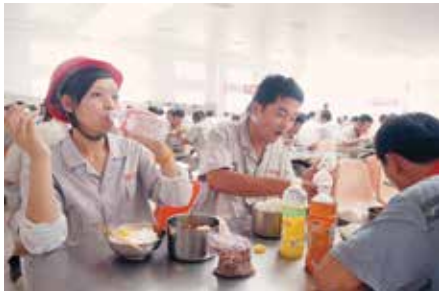
工作起来经常是连停车喝水的时间都没有