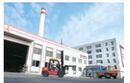
生产旺季，叉车工的工作强度也不断增加