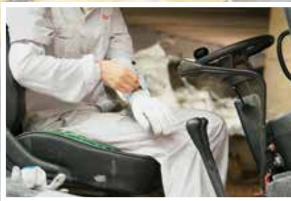
小向的袖口上绣着一朵小花