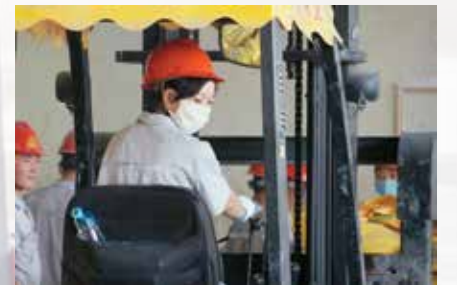
连日降雨增加了驾驶员的工作难度