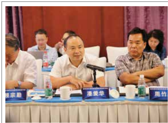
潘爱华 工业和信息化部原材料工业司副司长

为促进控释肥料产业的标准化、推动化肥行业健康发展，来自工业和信息化部、国家标准化管理委员会、中国石化联合会、上海化工研究院、全国农业技术推广服务中心、山东农业大学、金正大集团等政产学研各界的多位领导专家齐聚一堂，对控释肥料国际标准进行了深入解读，共同研讨未来控释肥料的规范应用。