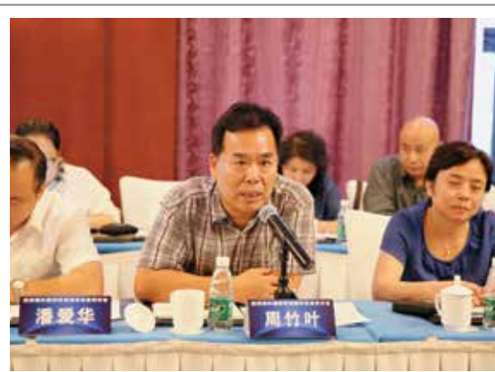
周竹叶 中国石油和化学工业联合会副会长、中国磷复肥工业协会理事长

标准是在市场经济条件下开展行业管理的一个重要手段。通过标准可以规范市场秩序，提高产品标识，引导消费升级。下一步，控释肥料优势企业应该加大技术输出，鼓励上下游企业合作，特别要与氮肥企业加强合作，实现互利共赢抱团取暖，共同推动产业升级。同时，借助标准的国际化积极开展国际产能合作，借助“一带一路”战略，到海外建厂，拓展利用国际市场、国际资源。