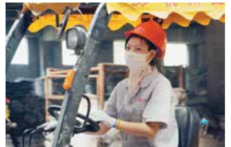
夏日的阳光格外“热情”