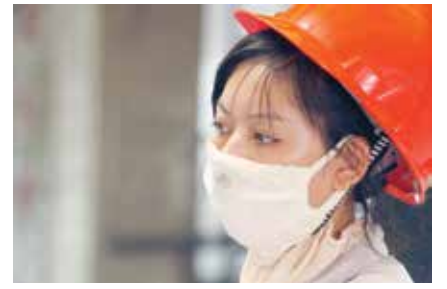
工作期间口罩是标准配置