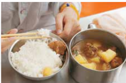
丈夫已经给她打了土豆炖排骨和米饭