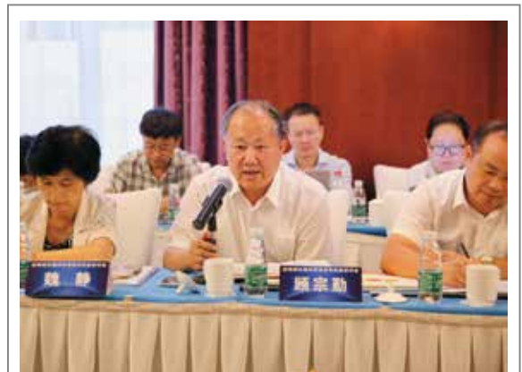
顾宗勤 中国氮肥工业协会理事长、石油和化学工业规划院院长

控释肥料是化肥产业发展的方向。而控释肥料国际标准由我国主导，表明我国掌握了整个肥料调结构转方式发展的方向。此次国际标准的制定实施，表明我国肥料产业进入一个新的发展阶段，即中国的标准要国际化、技术要国际化、产品要国际化、装备要国际化，这也是调结构转方式的重要领域和内容，当然也是：“一带一路”工作的重点。