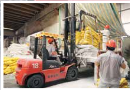
还肩负原料位置调整、为投料口上料等任务