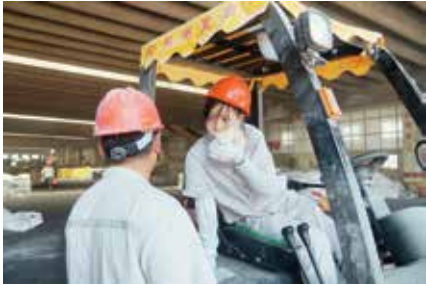
听班长交待工作中需要调整和注意的事项