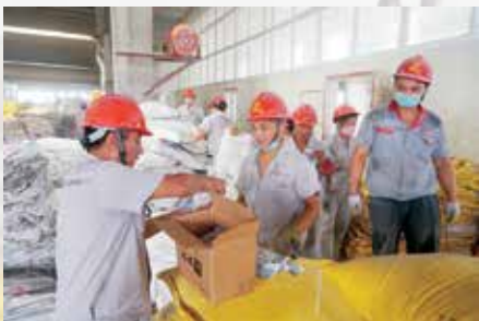
发放雪糕或冷饮，供大家解暑降温