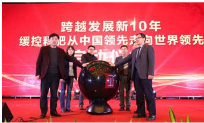
术升级、应用推广等方面的研发力度，继续保持世界前沿技术的探索与引领；在联合发展上，金正大将充分利用技术创新成果，努力通过

在技术研发创新上，依托企业自身科研平台，联合国内外科研机构，加大缓控释肥基础研究、技