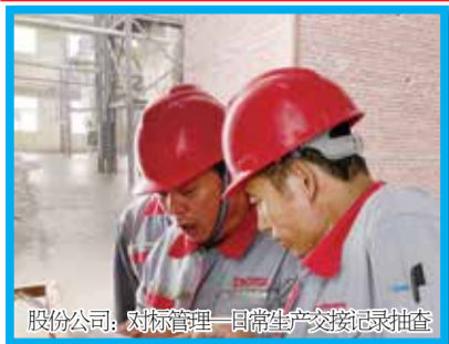
股份公司：对标管理—日常生产交接记录抽查