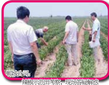
郸城公司：辣椒示范田考察，现场答疑解惑

后勤工作是公司运作的基础。辽宁公司要在精细化上做好文章，后勤日常管理工作中做到细化、务实、精致，努力为营销一线人员提供优质服务、高效服务、用心服务。在营销转型过程中，后勤工作要紧紧围绕服务营销开展，要把服务营销工作放在第一位，真正做到全员聚力、上下一心，为推动公司的营销转型和健康发展奠定良好的基础。