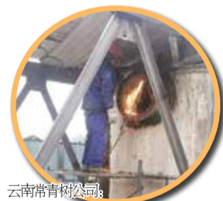
云南常青树公司：为生产保驾护航