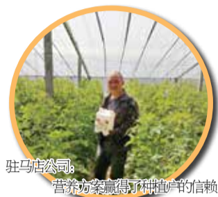
驻马店公司：营养方案赢得了种植户的信赖