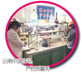
云南中正公司：严把质量关