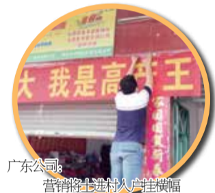
广东公司：营销将士进村入户挂横幅