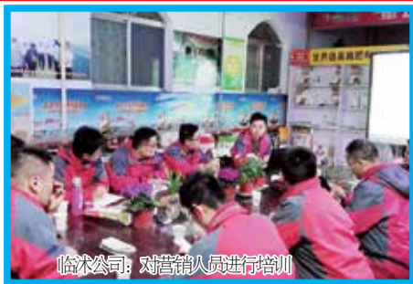
临沭公司：对营销人员进行培训