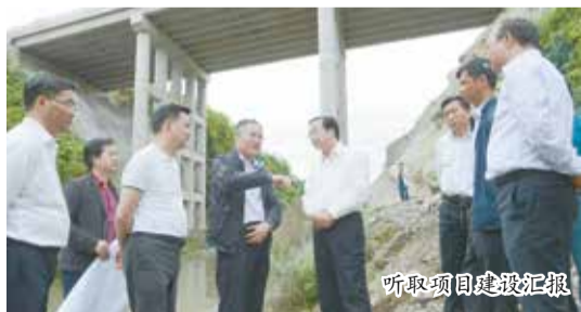
听取项目建设汇报

本报讯 通讯员李晓晓报道 5月4日,贵州省委常委、黔南州委书记龙长春莅临金正大诺泰尔化学有限公司开展环保督导调研。通过实地调研和听取汇报,龙长春对瓮安