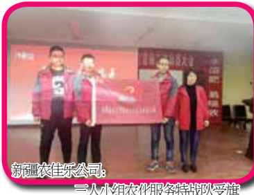
新疆农佳乐公司：三人小组农化服务特战队受旗