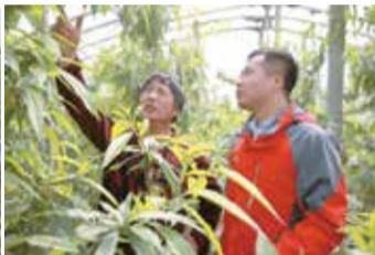
金正大农科院专家为农户讲解油桃管理技术