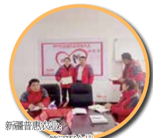
新疆普惠农业：签约军令状