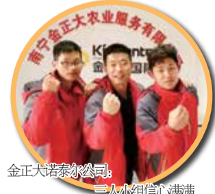
金正大诺泰尔公司：三人小组信心满满