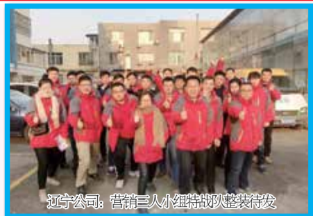
辽宁公司：营销三人小组特战队整装待发

2017年自公司“服务营销”确立以来，全体员工，立足本职岗位，查缺补漏，从思想意识，到行动措施，一时间公司出现“比学赶超、创先争优”的良好氛围，公司服务营销转型如火如荼的开展着。从“三人小组、农化服务中心”建设到全员服务营销，再到市场一线服务，都取得了良好的成绩，迎来开门红，为公司营销转转型，奠定了良好的开端，打响了第一枪。