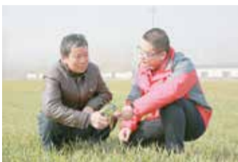
国家缓控释肥工程技术研究中心农艺师与农户察看小麦长势