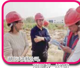
湖北沃夫特公司：项目建设一丝不苟