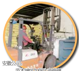
安徽公司：降本增效加强生产管理