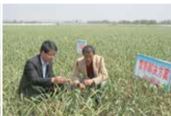
沃夫特大蒜研究所专家为农户讲解大蒜管理技术