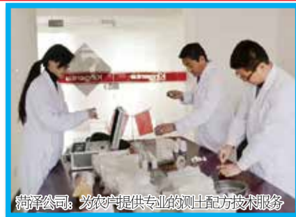
菏泽公司：为农户提供专业的测土配方技术服务