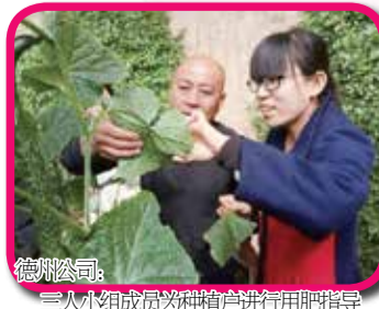
德州公司：三人小组成员为种植户进行用肥指导