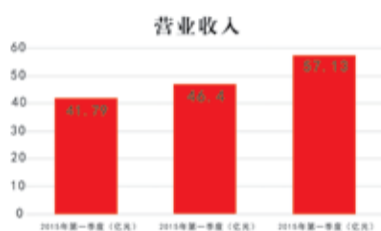
金正大一季度销售收入持续增长

业技术指导,保证营养解决方案落地推广,向实现“世界领先的植物营养专家和种植业解决方案提供商”的愿景不断迈进。